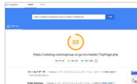
パソコンでのページ表示速度 最適化スコアの算出データ

参照データ：ページ表示速度の最適化スコア診断ツール「PageSpeed Tools」