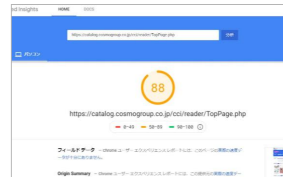
パソコンでのページ表示速度 最適化スコアの算出データ

参照データ：ページ表示速度の最適化スコア診断ツール「PageSpeed Tools」