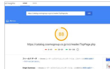
パソコンでのページ表示速度 最適化スコアの算出データ

参照データ：ページ表示速度の最適化スコア診断ツール「PageSpeed Tools」