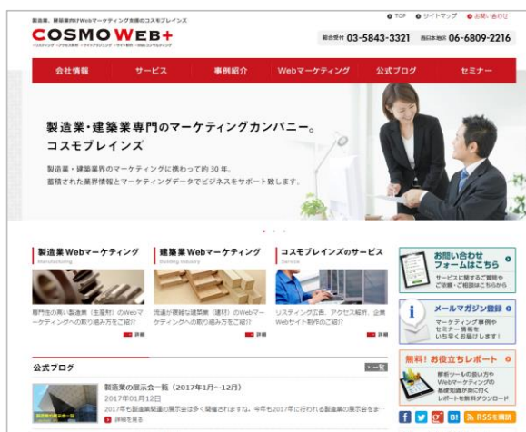
パソコン用のサイト