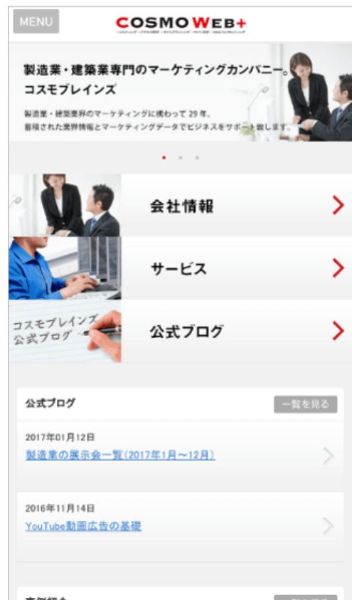
モバイル対応のサイト