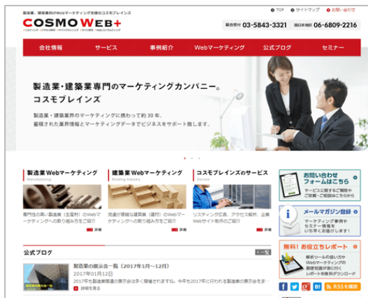
パソコン用のサイト