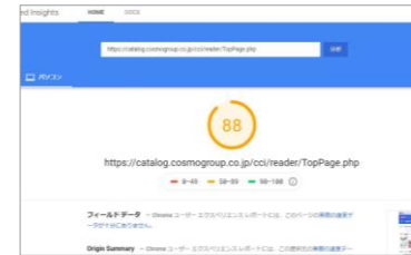
パソコンでのページ表示速度 最適化スコアの算出データ

参照データ：ページ表示速度の最適化スコア診断ツール「PageSpeed Tools」