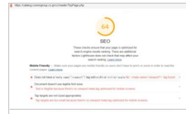
内部SEO評価スコア 算出データ

SEOとは、検索エンジンの自然検索結果でより上位に表示されるようにWebサイトを最適化すること。その中でも内部SEOは、サイトの内部構造やコンテンツを改善することで検索エンジン側に正しく評価してもらえるように対策することを指す。