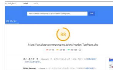
パソコンでのページ表示速度 最適化スコアの算出データ

参照データ：ページ表示速度の最適化スコア診断ツール「PageSpeed Tools」