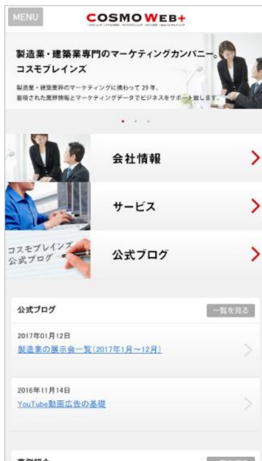
モバイル対応のサイト