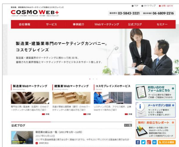
パソコン用のサイト