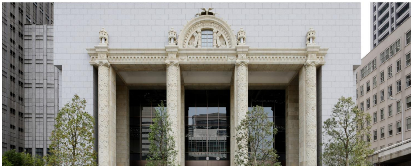
施工例：中之島ダイビル